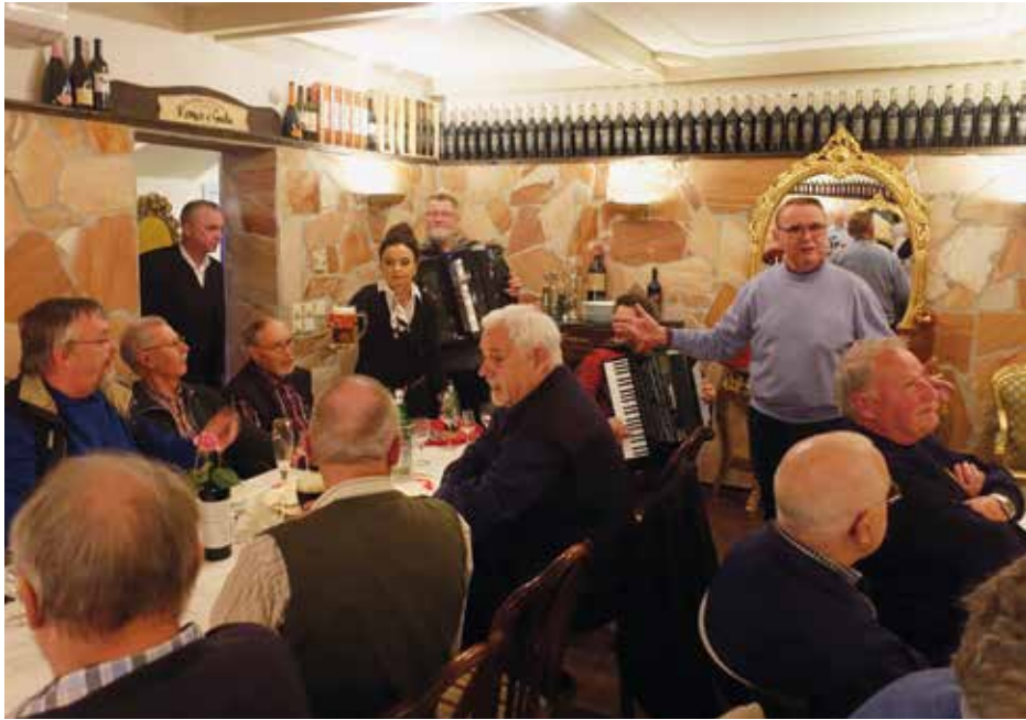
Kameradschaftsabend im Romeo é Giulia

es, Auftrittskleidung anlegen und auf den Beginn der Veranstaltung warten.