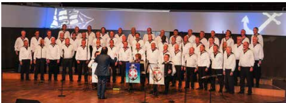
Der Auftritt des Seemanns-Chors

Nachdem wir Stellproben mit Auf- und Abgängen und den Sound Check erfolgreich hinter uns gebracht hatten, wurde noch ein Essen in der Gewandhaus-Kantine eingenommen und dann hieß