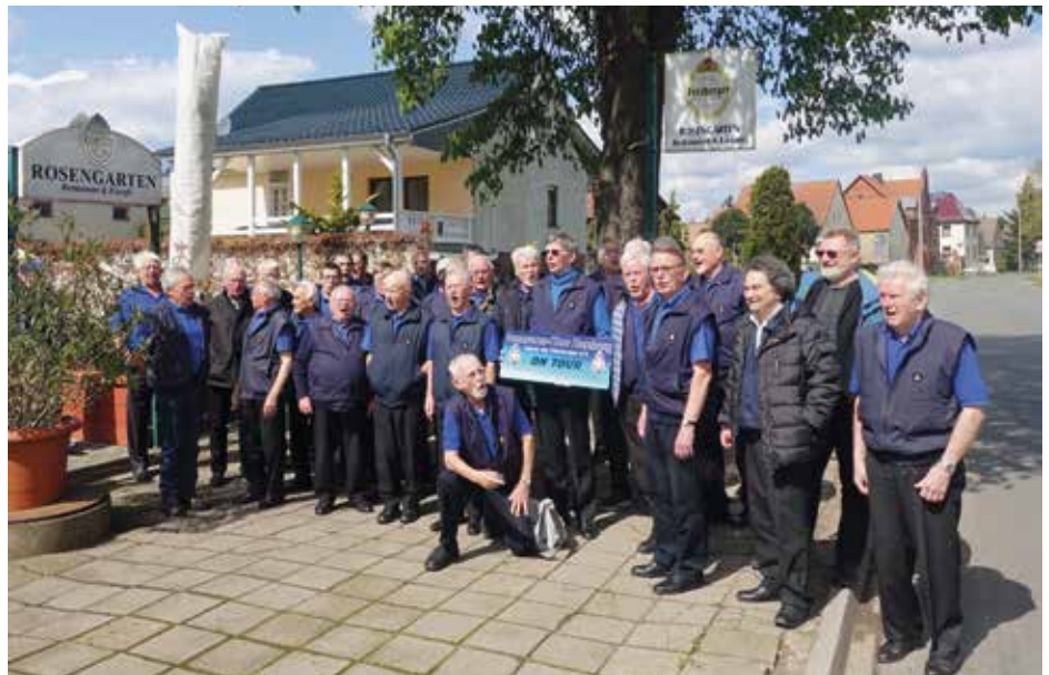
Zwischenstopp im Restaurant Rosengarten in Altenweddingen

Gesagt getan: Nur eine Woche nach den Frühjahrskonzerten im Theater an der Marschnerstraße ging es am Ostermontagsmorgen mit 50 Sängern, davon drei Sänger