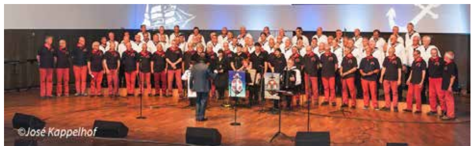
Das Finale mit allen drei Chören

Wieder im Zentrum angelangt setzten wir unsere Stadtbesichtigung zu Fuß fort. Ziele waren die