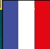
Shantyband Pavillon Noir Frankreich