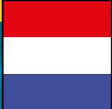
Shantychor Compagniezangers Holland